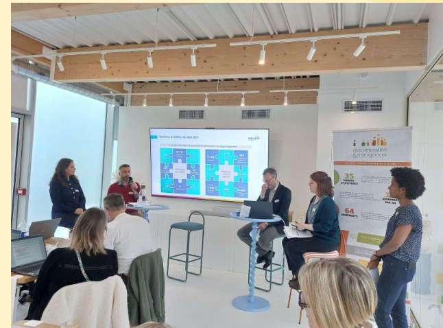
Photos de l'atelier « IA et organisation du travail » - 17 juin 2025