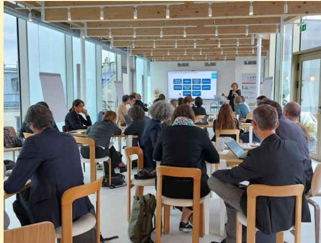
Photos de l'atelier « CRC, état des lieux et perspectives » - 6 novembre 2025