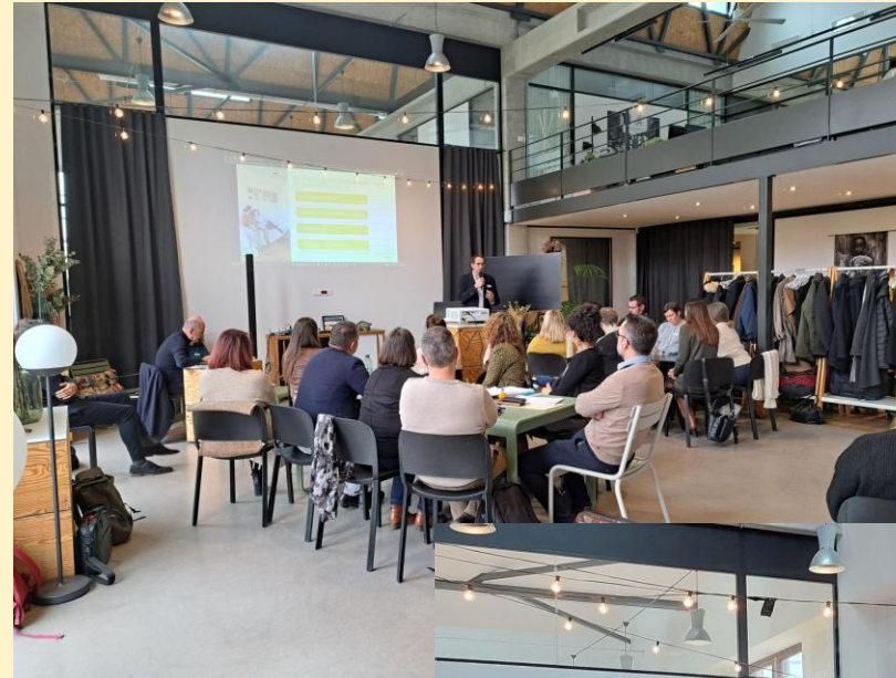
Photos du séminaire 2025

Le 26 et 27 novembre 2026, le séminaire aura pour thème « l'agence, hub territorial »